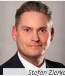
Stefan Zierke Mitglied des Bundestages aus Prenzlau