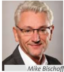
Mike Bischoff Landtagsabgeordneter aus Schwedt